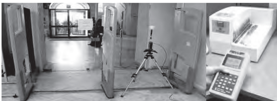
Figura 2: A sinistra misura dell'esposizione nel punto di passaggio di un doppio varco di un sistema antitaccheggio. A destra misura dell'esposizione percentuale a breve distanza da uno smagnetizzatore

anziché in termini di valore a banda larga. Infatti quest'ultimo porterebbe ad un'ambiguità sul corrispondente valore limite da utilizzare, visto che per i campi elettromagnetici i limiti variano molto con la frequenza. Inoltre considerando che i segnali emessi dalle apparecchiature analizzate erano stazionari, il confronto con i limiti è stato possibile anche utilizzando uno strumento senza rivelatore di picco (come ad esempio il modello EFA 300 della NARDA). In Figura 2 sono mostrati, a titolo di esempio, un doppio varco magnetico ed uno smagnetizzatore durante l'effettuazione della misura delle emissioni.